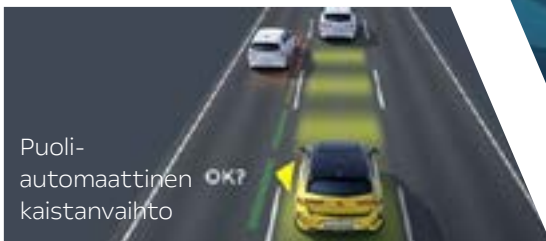
Puoli- automaattinen kaistanvaihto